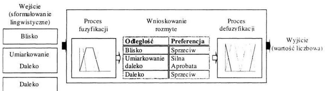
Rys. 5. Schematyczny diagram procesu przetwarzania informacji słownej

Całkowity proces przetwarzania informacji słownej w wartość liczbową przedstawia rys. 5 [9]. Informacja słowna, opisująca preferencje ludności, przetworzona w wartość liczbową jest użyteczna w obliczeniach komputerowych.